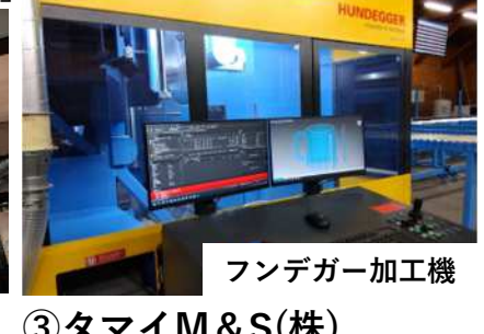
フンデガー加工機