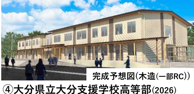
完成予想図(木造(一部RC))

④大分県立大分支援学校高等部(2026) ・建築中現場視察 延床面積1,922㎡