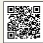
大分県女性活躍推進ポータルサイト