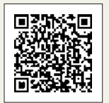
働きたい女性応援サイト