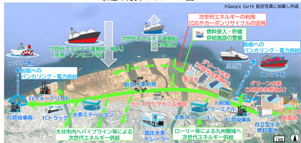
取組み方針のイメージ図