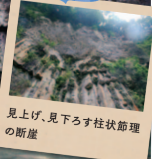
見上げ、見下ろす柱状節理の断崖