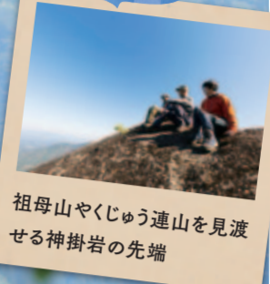
祖母山やくじょう通山を見渡せる神掛岩の先端