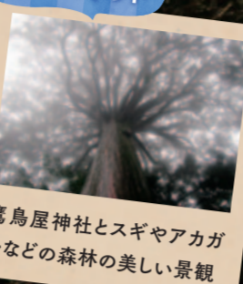
鷹鳥屋神社とスギヤアカガシなどの森林の美しい景観