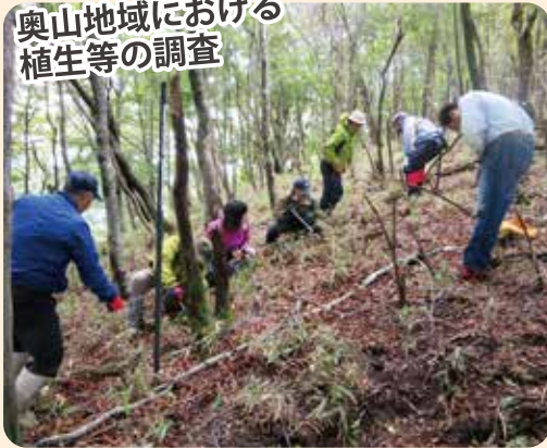
奥山地域における 植生等の調査

祖母・傾・大崩山系の豊かな自然を守り、その姿を次世代に残していくため、貴重な原生林の保護を図るとともに、植樹や適切な森林の多機能化を図る取組、生態系等に関する調査、鳥獣被害対策や河川環境改善の取組などが行われています。