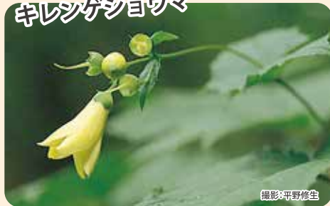
キレンゲシヨウマ