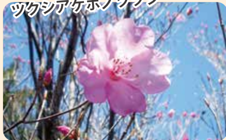
ツクシアケボノツツジ

標高1,000m以上の高山で見られる九州特産種で、春には多くの登山者を魅了します。