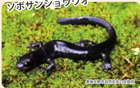
ソボサンシヨウウオ