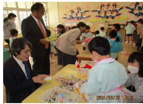
来店したお客さんとの会話・やりとりが楽しい。「たこ焼きください。」「たこ焼きどうぞ。」「本物みたいだね。」