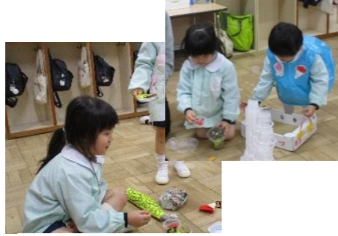
「お腹すいたなあ。」「配達をお願い、されてますよー。」デリバリーのお店屋さんが登場。