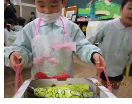
トウモロコシ店のお客さんが減ってくる、移動販売を始める。