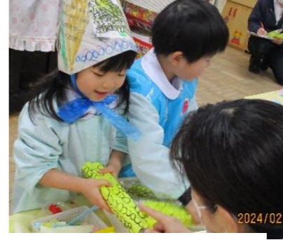
「温かいのが欲しいんですけど。」保育者が注文すると、回して焼き始めるA児。