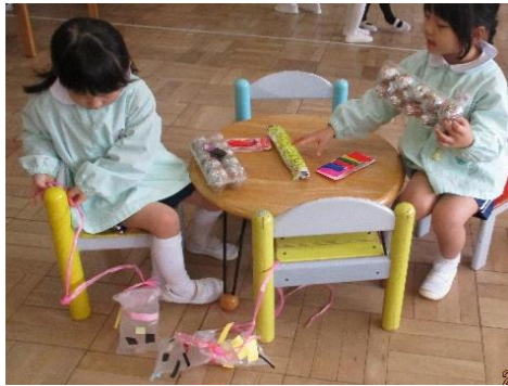
手作りペットと一緒にお客さん役を楽しむ。