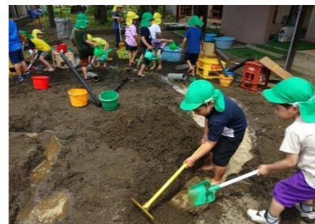
もっと深く掘ってみよう