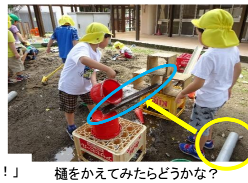
樋をかえてみたらどうかな？