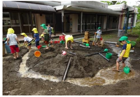
「本当につながってる！」「やったあ！」