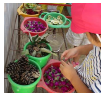
材料が置いてある棚から、必要なものを選びカップに入れるA児