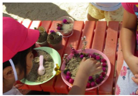
「きれい！旗の飾り、付けたら？」