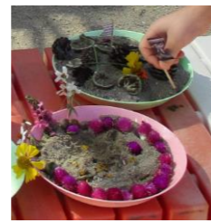
友達の考えを取り入れて、旗を付けてみるB児