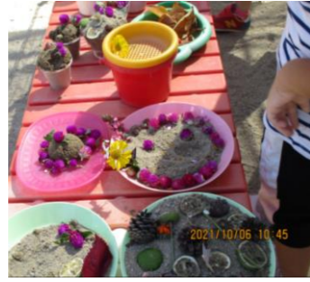
作ったケーキが並べられた台