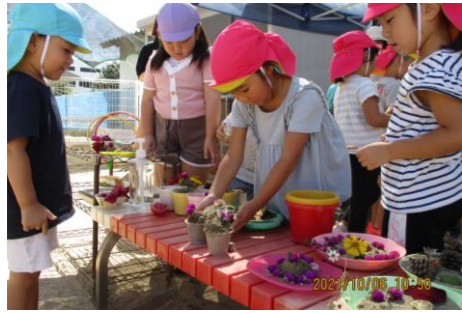
3歳児のお客さんに「いらっしゃいませ！」