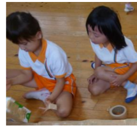
どうやって 裏側に貼ろうかな？