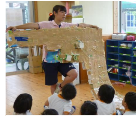
本当に、プールに入るのかな？