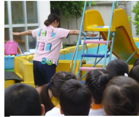
(舟の大きさは)先生の手で測ったら？