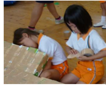
大変そう。 切ってあげるよ。