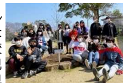
杵築市立東小学校卒業生のみなさん