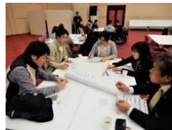
おおいた青年交流祭

新型コロナウイルスの影響で、連合青年団としての活動はほとんど行っていない現状です。その中でも、オンラインを活用した交流や学習、少人数でもできる活動を少しずつはじめ、令和3年度はこうした状況下でも青年と地域がつながることができる活動を展開していきます。また、昨年度から延期となった「全国青年団OB会in大分」にも参加や運営協力をし、全国や大分県内各地で頑張ってきたOBの皆様との交流を通じ、青年団や地域活動、青年時代に大切なことを学習していきます。時代に合った新しい活動方法を採り入れつつ、昔から変わらない大切な思いをもって今後も活動してまいります。