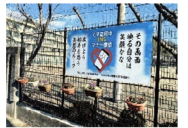
生徒作「SNSマナー標語」