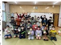
鶴崎子ども食堂のみなさん