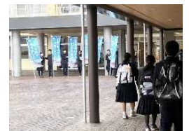
生徒作の「あいさつ標語」 くす星翔中登校風景

そこで、新設のくす星翔中学校への支援として、生徒たちが考えた「あいさつ標語」「SNSマナー標語」を啓発職や看板にしました。自分たちの課題をよく把握し作られた標語は素晴らしいもので、生徒会活動に活用してくれています。