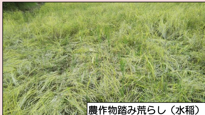
農作物踏み荒らし（水稲）