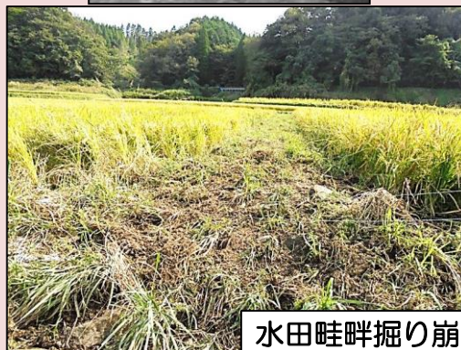
水田畦畔掘り崩し