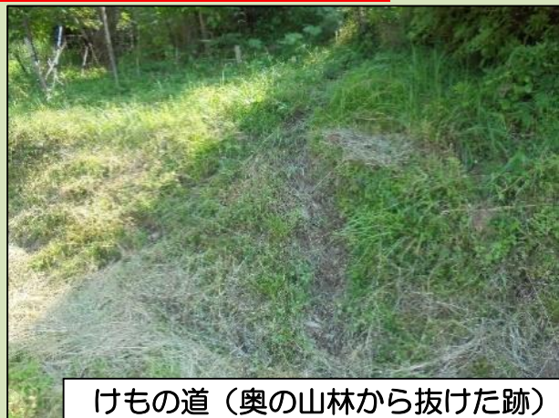
けもの道 (奥の山林から抜けた跡)