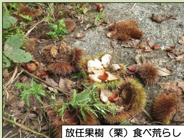
放任果樹 (栗) 食べ荒らし