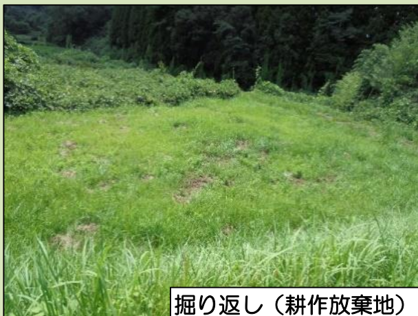
掘り返し (耕作放棄地)