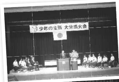
米田審査委員長による講評