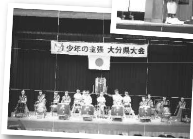
アトラクション (やよい榎牟礼 陣太鼓保存会による演奏)