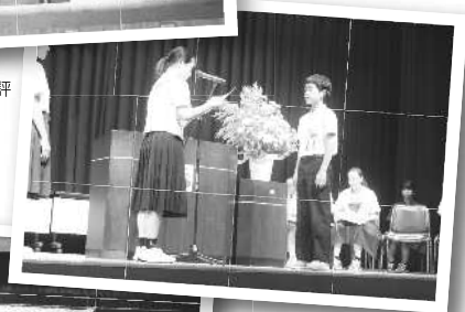
中学生審査委員から共感賞を授与