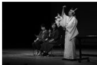
(寸劇による講座の様子)