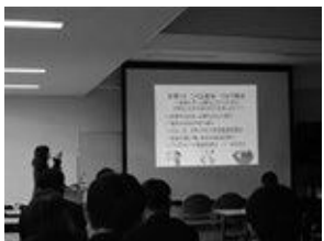
(全世代を対象に講座を実施中)

事例を分かりやすく伝えるため、講義形式だけでなく、寸劇による講座も実施しています。消費生活相談員が、消費者や悪質業者に扮して、消費者が狙われやすい事例を楽しく紹介します。(最小催行人数の設定あり)