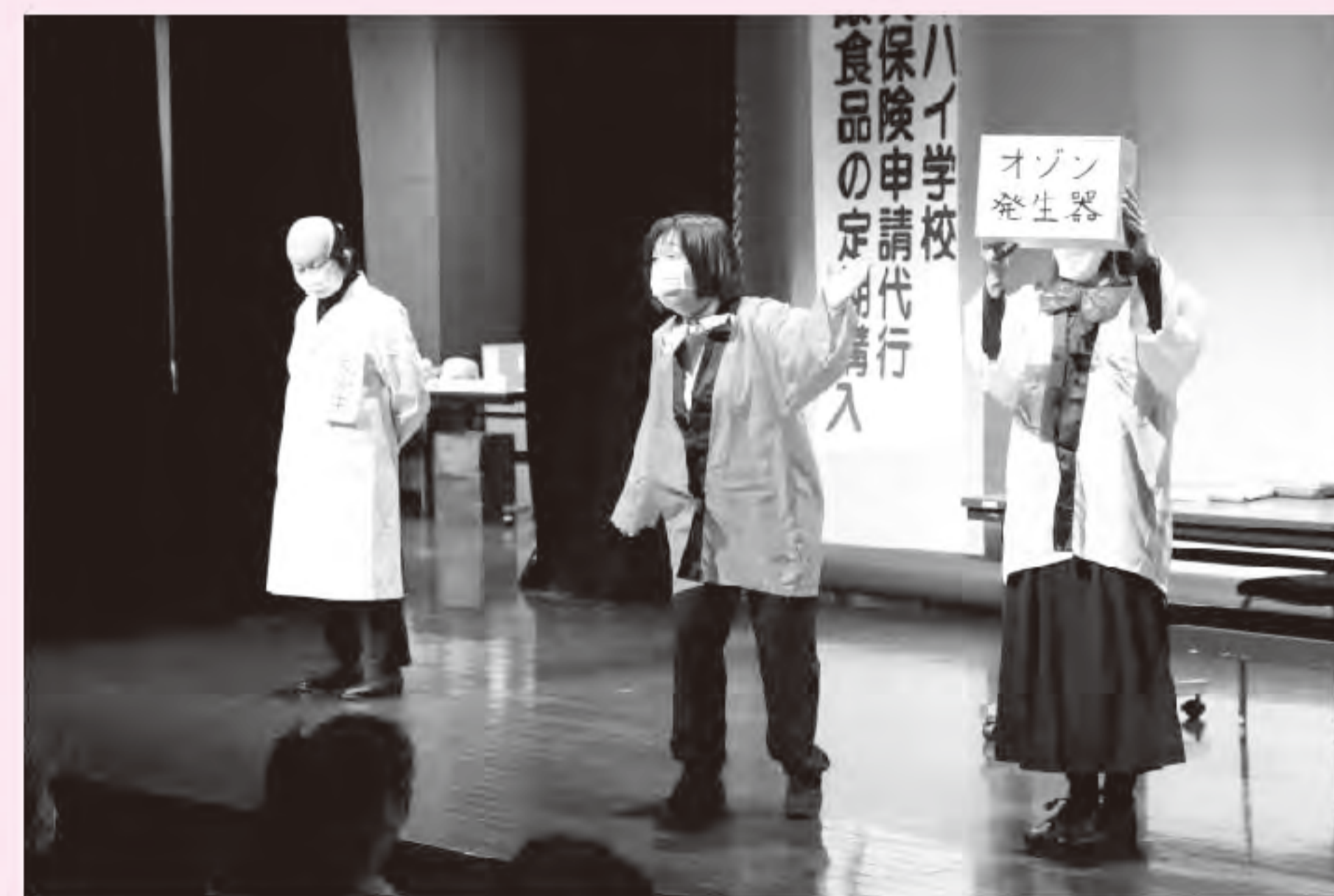
(寸劇による講座の様子)

事例を分かりやすく伝えるため、講義形式だけでなく、寸劇による講座も実施しています。消費生活相談員が消費者や悪質業者に扮して、消費者が狙われやすい事例を楽しく紹介します。