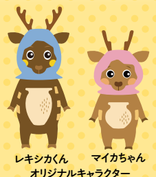
レキンカくん マイカちゃん オリジナルキャラクター