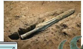
中広形銅矛 (大分県指定有形文化財) 猪野遺跡 (大分市教育委員会蔵)

謎の青銅器「巴形銅器」。弥生時代の巴形銅器は、全国でも40例ほどしかありません。大分県からは唯一、雄城台遺跡から出土しています。各地から出土した巴形銅器や青銅器を展示するとともに、AR技術を用いて普段は見ることができない巴形銅器の裏側をご紹介します。