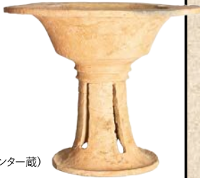
高坏 浜遺跡 (大分県立埋蔵文化財センター蔵)