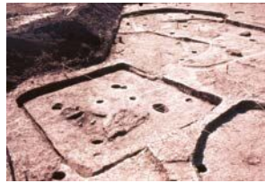
竪穴建物跡 (雄城台遺跡)

雄城台遺跡の発掘調査成果を基に、当時の人々が暮らしていた建物の姿を想定して3Dデータで復元しました。ぐるっと360°周囲を見ることができ、内部まで詳細に再現しています。実際に遺跡から発掘された遺物たちとデジタル技術を組み合わせ、弥生時代の暮らしをご紹介します。