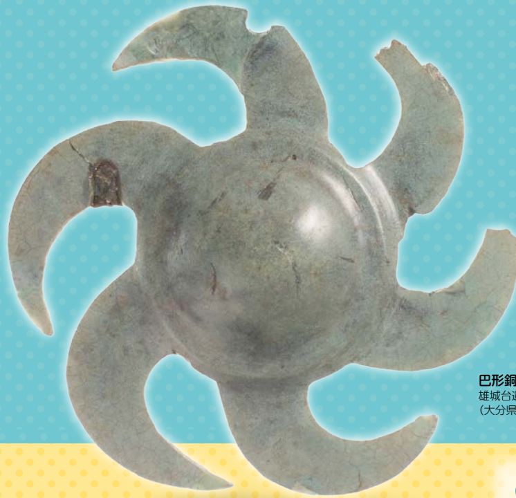
巴形銅器 (大分県指定有形文化財) 雄城台遺跡 (大分県立埋蔵文化財センター蔵)