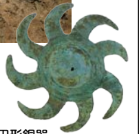
巴形銅器 新御堂遺跡 (熊本市教育委員会蔵)