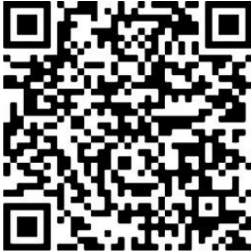
電子申請アドレス QR コード