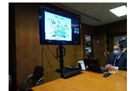
講座の風景 モニタールーム