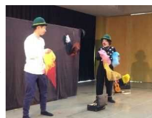
チカパンの大道芸

今後子どもが育つ環境が豊かな文化にあふれ、心豊かに成長できる場となるように、県内の子ども劇場と共に取組を進めたいと思います。