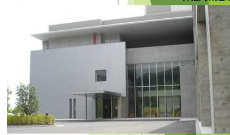
衛生環境研究センター