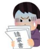
相談事例からみる「荷受代行」・「荷物転送」の手口

・「荷受代行」をしたら、自分名義でスマートフォン6台を購入されており、請求書が届いた。（20歳代女性）