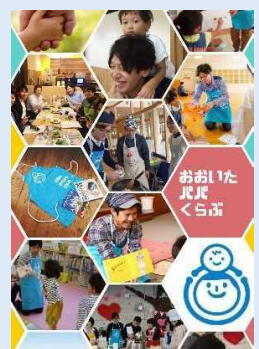
おおいたパパくらぶ 会員のみなさま

【おおいたパパくらぶ】 「ムリをしない、強制されない、自分自身が楽しむこと」をモットーに、 県内広域で活動中のパパサークル。父親同士のつながり作りの大切さや 子育ての楽しさを、お子さんとの遊びを通じてパパ目線で伝えている。