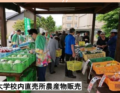
農業大学校内直売所農産物販売