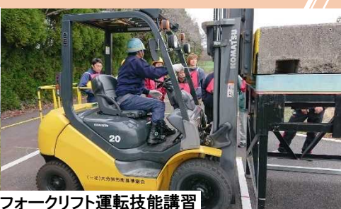
フォークリフト運転技能講習