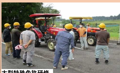
大型特殊免許研修