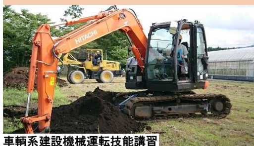
車輛系建設機械運転技能講習