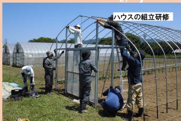
ハウスの組立研修