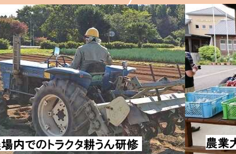
農場内でのトラクタ耕うん研修