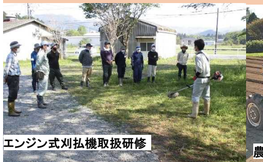
エンジン式刈払機取扱研修