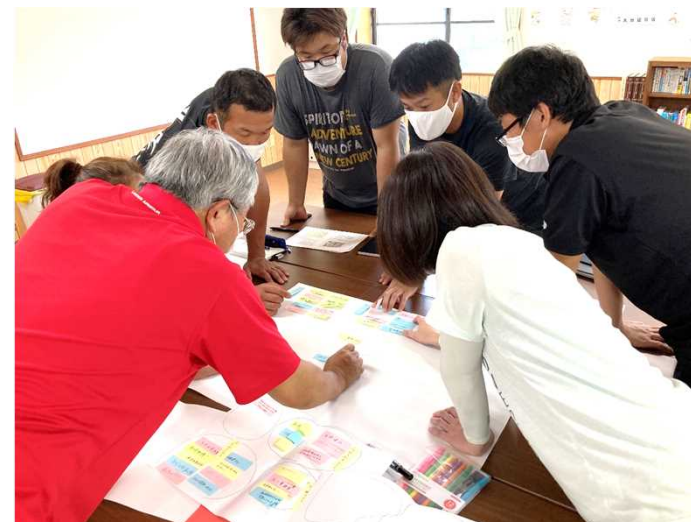
カエル会議の継続実施