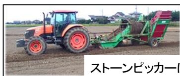
ストーンピッカーによる除レキ