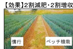
【効果】2割減肥・2割増収