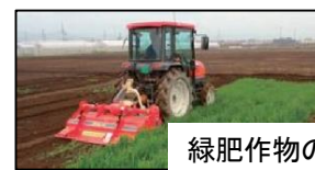
緑肥作物のすき込み