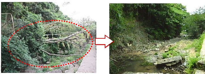
河川内の支障木伐採

土木事務所では、災害発生時などに迅速な対応ができるよう、日頃から防災資機材を備蓄するなど地域防災力の向上に努めます。また、防災や生活環境の保全等を図るため、河川等の支障木伐採や管理道の整備等を行います。