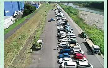
駅館川河川愛護活動