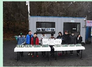
別府一の宮線の橋名板 お披露目・取付式