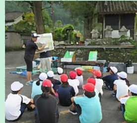
防災教室の様子 (中津市立下郷小学校)