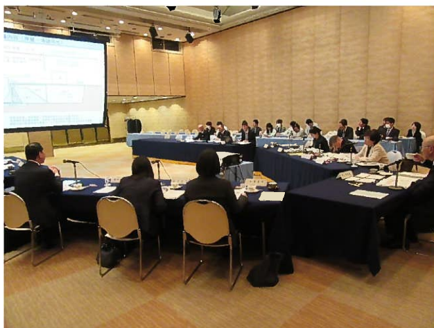
事業評価監視委員会の状況

令和元年度の事業評価監視委員会では、土木建築部、農林水産部あわせて事前評価対象5事業、再評価対象19事業、事後評価対象3事業の計27事業が審議され、各々の対応方針案について「妥当」であるとの審議結果が知事あてに答申されました。