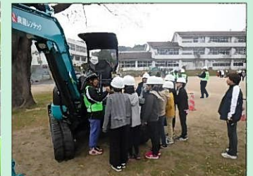
小学校出前講座 (豊後大野市立大野小学校)