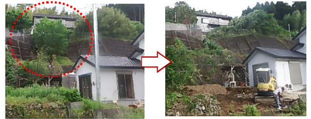
急傾斜地の立木撤去