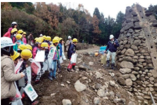
小学生による農業水利施設の見学会

県主催の水土里資源を巡る親子バスツアー等各種イベントを通じ、農業・農村のすばらしさや大切さを広く県民にPRするとともに、市町村等が主催する農業祭等のイベントに積極的に参加し、写真やパネル展示等のPR活動を行います。