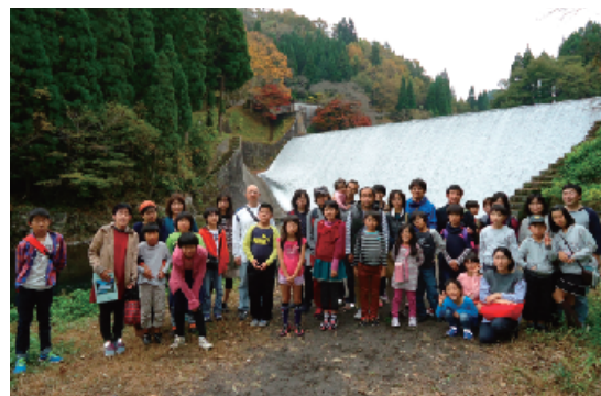
第1回水土里資源を巡る親子バスツアー