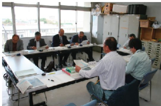
環境情報協議会開催状況

協議会は各振興局ごとに設置しており、野生動植物種（鳥類・水生生物・昆虫類・植物）、環境・景観、農業の関係者から構成されています。