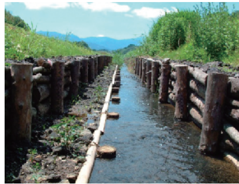
生態系保全型水路