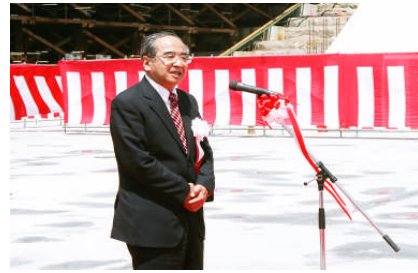
定礎宣言 (広瀬勝貞大分県知事による定礎宣