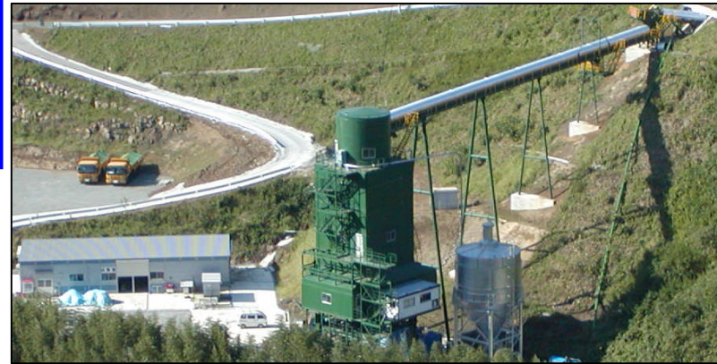
ダム本体のコンクリートを製造する設備です。