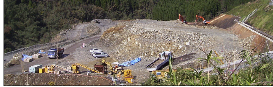
コンクリートを作るための砕石を採取する山です。