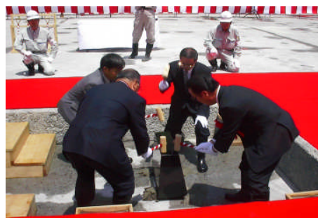
齋槌の儀 (定礎石を木槌で叩き固定しました。)