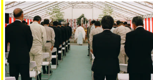
神事 (定礎石及び現場を清められました。)

6月13日(月)、ダム堤体内で定礎式を広瀬勝貞 大分県知事他来賓各位、地域関係者他総勢約160名をお迎えして挙行されました。当日は当初雨の予報でしたが、一転汗ばむ程の晴天で定礎式