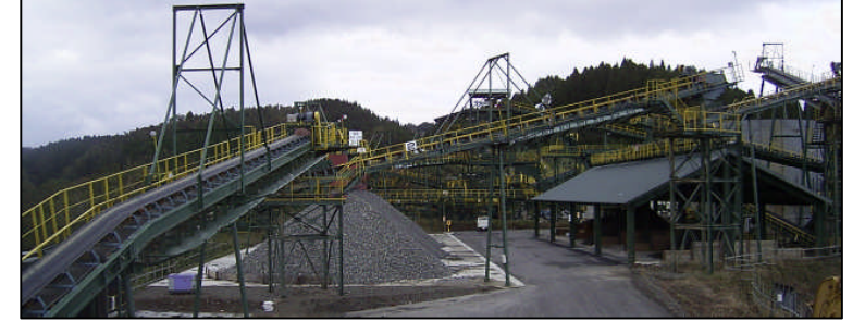
原石山で採取した原石を細かく砕き、コンクリー