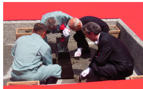
齋鍔の儀 (定礎石に打ち込んだコンクリート