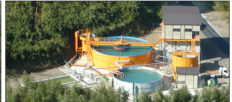
骨材プラントで発生する濁水を浄化しています。この