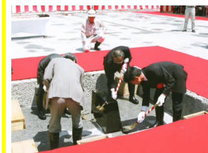
鎮定の儀 (定礎石にコンクリート(モルタル)を