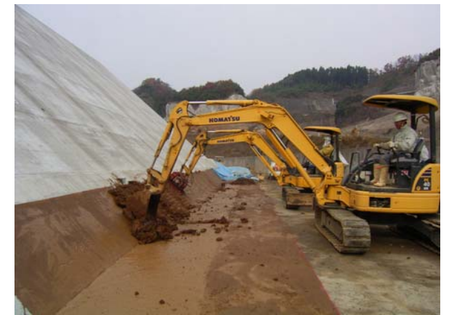
貯水池対策工事 撮影日:平成19年12月13日