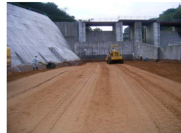
貯水池対策工事 撮影日:平成19年12月13日