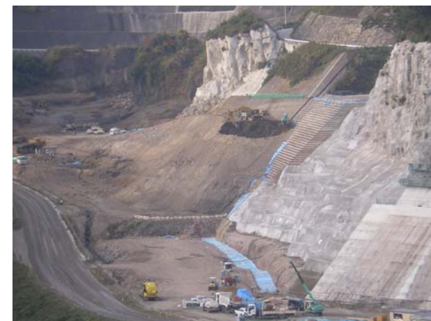
貯水池対策工事 撮影日:平成19年12月13日