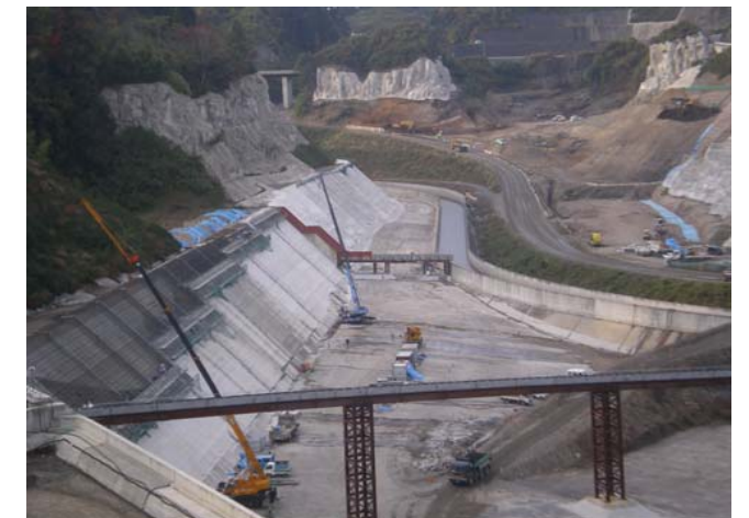
貯水池対策工事 撮影日:平成19年12月13日