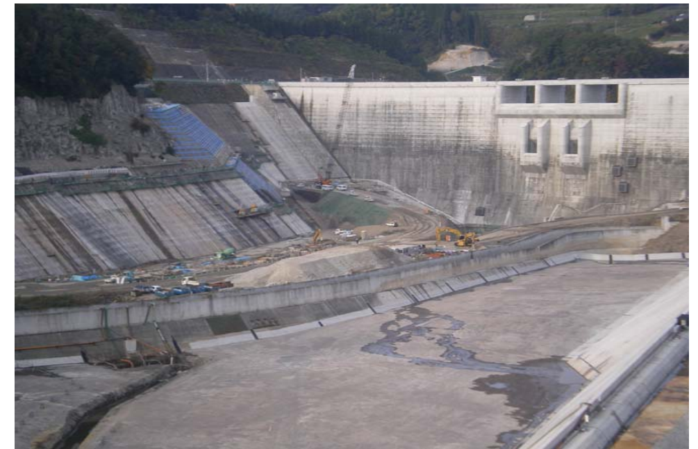
稲葉ダム本体工事 撮影日:平成19年12月13日