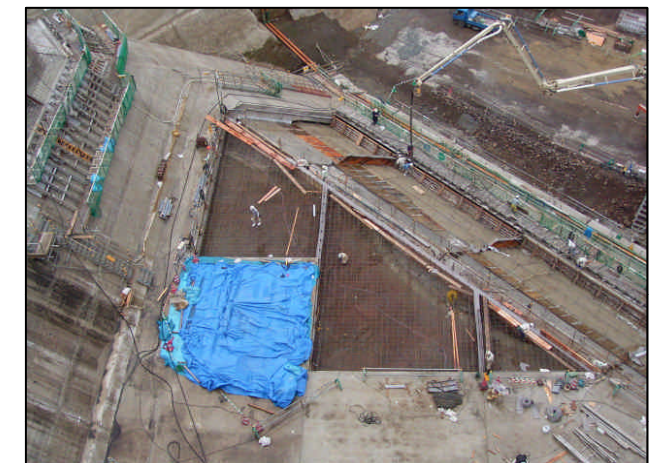
右岸貯水池対策工状況