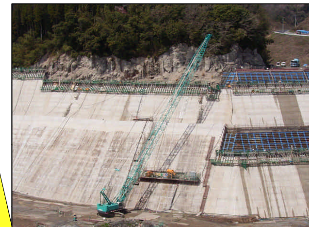
左岸(下流部)貯水池対策工状況