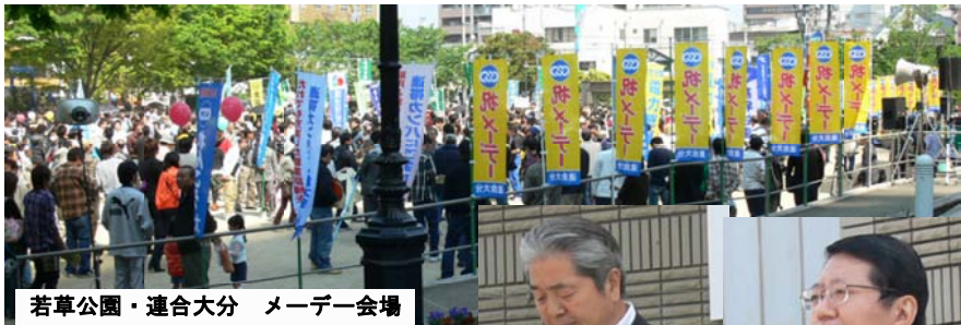
若草公園・連合大分 メーデー会場