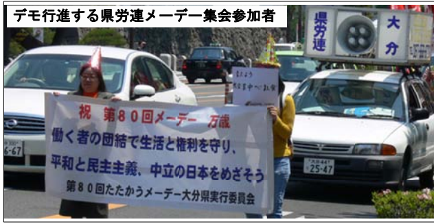
デモ行進する県労連メーデー集会参加者

6月26日、中国湖北省総工会友好訪日団が県を表敬訪問しました。中国湖北省総工会は、中国の地方労働組合の指導機関で、連合大分と相互に訪問団を派遣する等の友好交流を