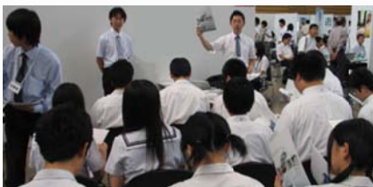
就職博で企業担当者の説明を聞く高校生

高卒者採用を予定している県内企業78社が個別ブースを開設し、県内の50校から約1,500人の高校3年生が参加しました。