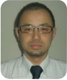
【執筆】 社会保険労務士