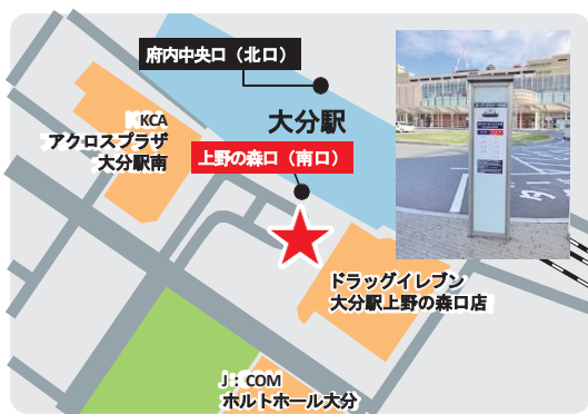
大分駅のりば 上野の森口 (南口)