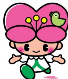
大分県人権啓発 イメージキャラクター こころちゃん

【募集期間】 令和8年6月15日（月） ～ 令和8年9月3日（木） ※郵送の場合は当日消印有効