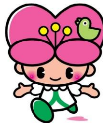
大分県人権啓発 イメージキャラクター こころちゃん

【募集対象】 県内の公立・私立高等学校、 特別支援学校高等部に在籍する生徒 及び15歳以上の県内に在住または 勤務する一般の方