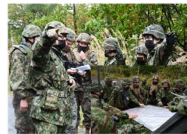
対着上陸戦闘訓練