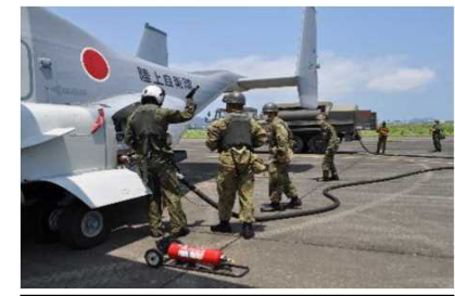
駐機・燃料補給・整備等