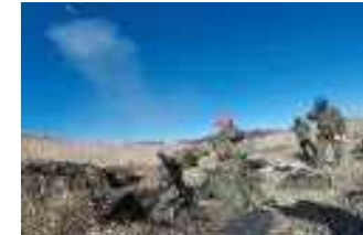
共同戦闘射撃訓練