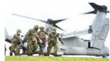
共同衛生訓練（患者後送等）