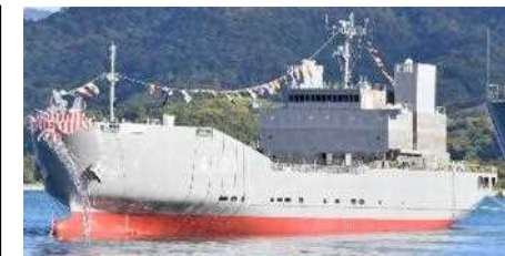
中型級船舶「ようこう」