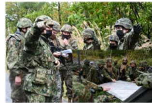
対着上陸戦闘訓練