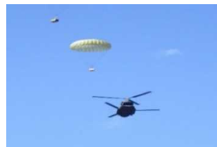
共同補給訓練（空中投下含む）