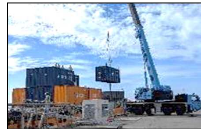
事前集積及び荷役訓練