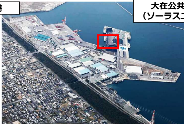
大在公共埠頭 (ソーラスエリア)