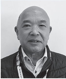
大分県人権教育・啓発推進協議会 人権啓発講師