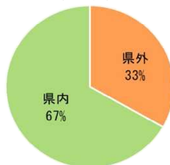
参入元企業の所在地割合