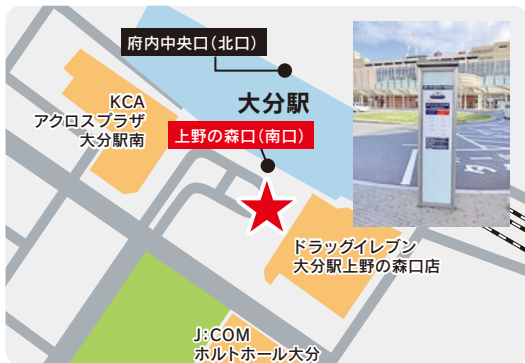
大分駅のりば 上野の森口(南口)