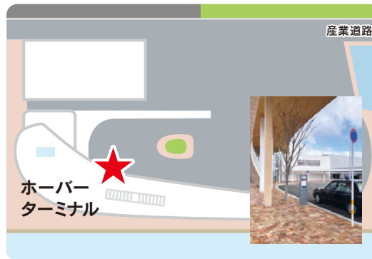
ホーバーターミナルのりば 旧無料シャトルバス乗場

利用者アンケートを実施 しています。下記の二次元 バーコードを読み込んで ご回答をお願いします。