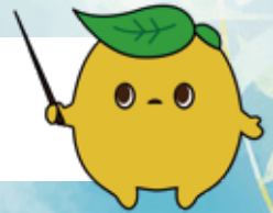
環境教育マスコットキャラクター 「エコ助」