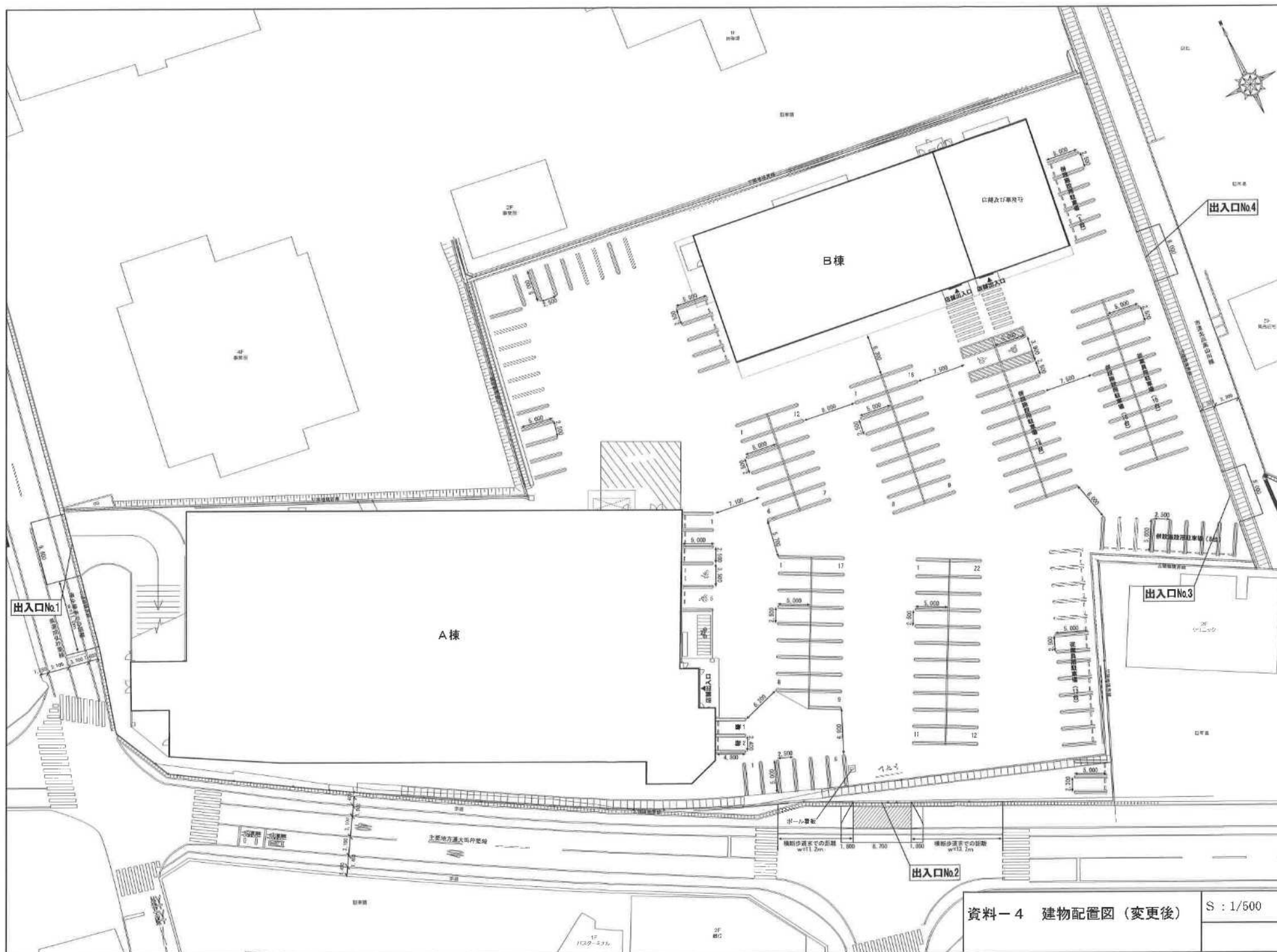
資料-4 建物配置図 (変更後)