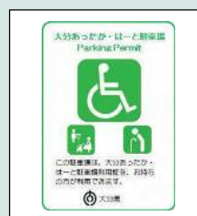
ステッカー （A2またはA3サイズ）