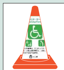
看板 （コーンカバー）