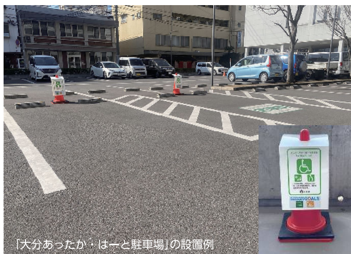
「大分あったか・はーと駐車場」の設置例

事業者の皆様には、本制度の趣旨をご理解いただき、「大分あったか・はーと駐車場」の設置にご協力をお願いいたします。