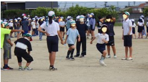
【全校縦割り長縄跳び】