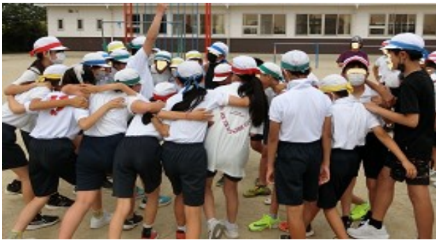
【校内ドッジボール大会】