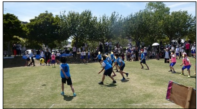
【市行事ドッジボール大会】