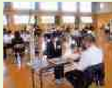
就職相談会(会社概要説明)