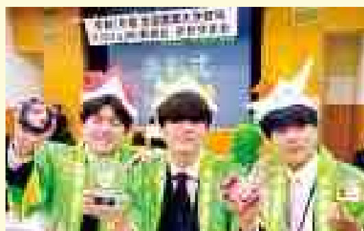
全国大会参加学生