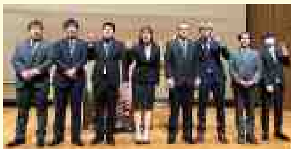
プロジェクト発表学生