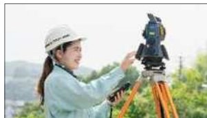
女性のロールモデル紹介(建設産業で活躍する女性)