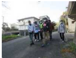
自主防災組織による避難訓練