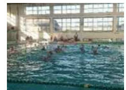
ハンガリー・アメリカ女子水球代表の県内合宿