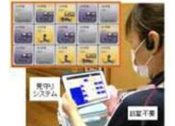
離床センサーと接続した見守りシステム