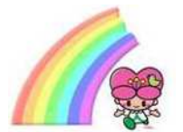
大分県人権啓発イメージキャラクター「こころちゃん」