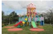
ハーモニーパーク (日出町)