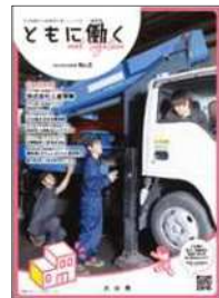
定期情報誌「ともに働く」(発行：大分県)