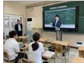
高等学校における遠隔授業