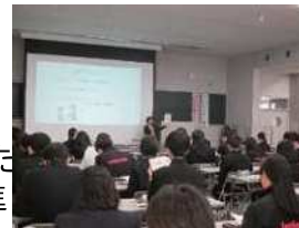
高校生を対象とした消費生活啓発講座