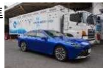
水素ステーションと燃料電池自動車