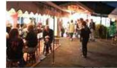
コミュニティビジネス (駅を活用した飲食イベント)