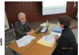
専門家(運営アドバイザー)による支援