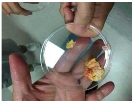
【写真12：シャーレに入った異物 （写真8、9の再掲）】