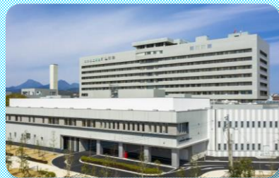
大分県立病院は県基幹病院の1つ!