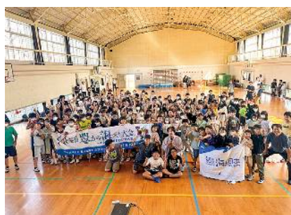
No.12 海の落語プロジェクト