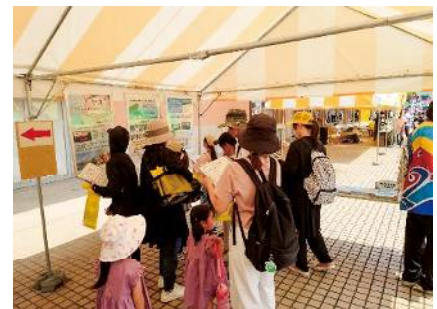
No.31 栽培漁業のパネル展示

子ども達を対象として、海や川を身近に感じられる様々なゲームや体験を企画、実施しました。