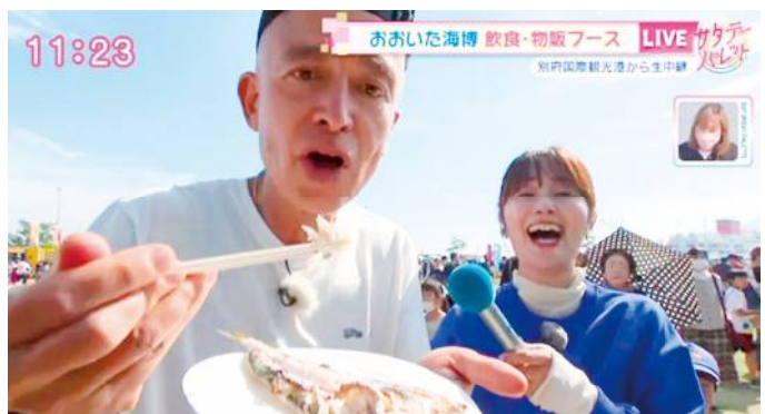
TOS サタデーパレット 令和5年11月4日(土)生放送 「1年前プレイベント」