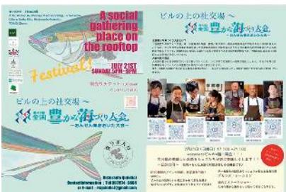
No.58 ビルの上の社交場