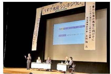
No.40 うすき水産シンポジウム