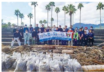
No.27 大分県協同組合協議会地域貢献活動