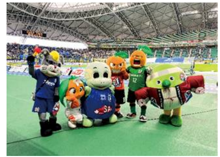
No.30 ピッチにめじろん登場