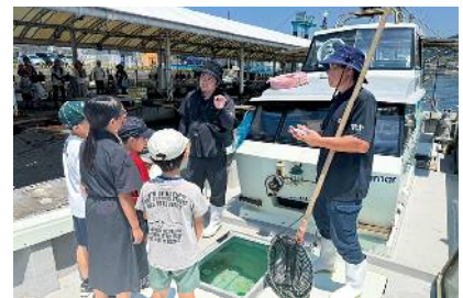
No.70 見て!感じて!体験しよう!! 県漁協佐賀関支店裏側ツアー