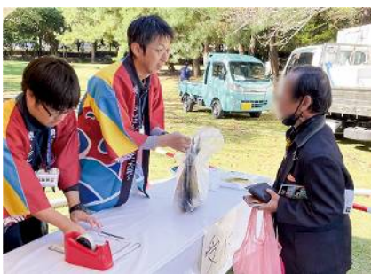
No.15 鮮魚捌きコーナーの出店