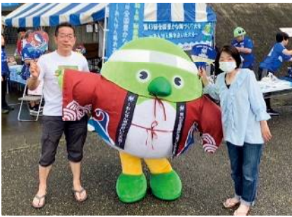
No.4 大会ノベルティの配布

大会専用法被を着た大会広報隊“鳥”「めじろん」と一緒に県内各地で大会PRを実施しました。