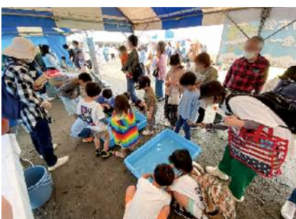
No.3 海の生き物タッチプール

子ども達を対象として、海や川を身近に感じられる様々なゲームや体験を企画、実施しました。