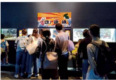
No.17 第43回全国豊かな海づくり大会 ～おんせん県おおいた大会～ 応援テーマ展示「大分県産『豊』流魚」