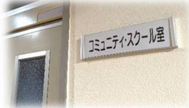
■ 玖珠町立くす星翔中学校のCSルーム