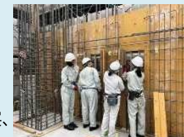
産業界との連携による インターンシップ