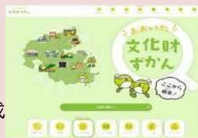
おおいた文化財ずかん