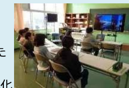
アバター操作体験及び 水族館体験学習