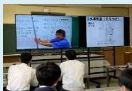
高校における遠隔授業