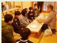
放課後・休日の 子ども体験活動 (陶芸教室)