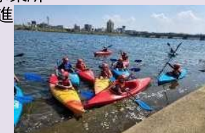
総合型地域スポーツクラブ活動 (大分川カヌー体験)