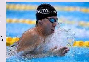
競泳（平泳ぎ）渡辺一平選手 (TOYOTA) @picsport_japan