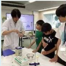
0-laboにおける 子どもの科学体験活動