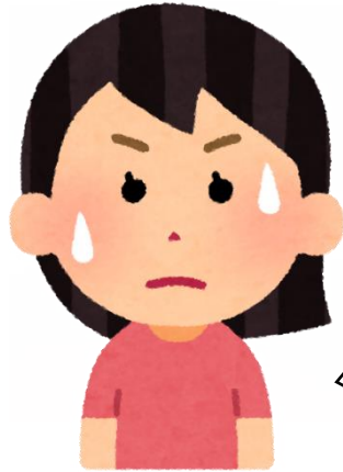
特別支援学級担任

子ども一人一人の実態が違いため、指導の方法も違います。関わる教職員の共通理解が難しいです。