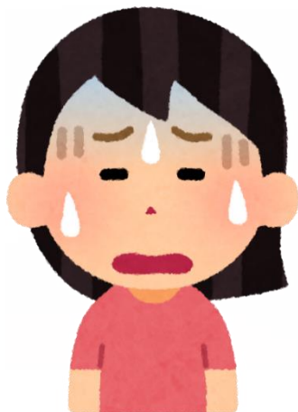
特別支援学級担任

通級による指導は、在籍学級担任との連携が絶対的に必要ですが、その時間確保が難しい……。