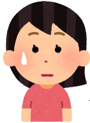
特別支援学級担任

Q23 自立活動の時間ではできますが、普段の生活で生かされていないことが多く、日常生活に生かせるようにすることが課題です。