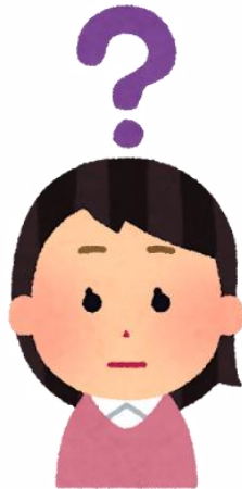
特別支援学級担任