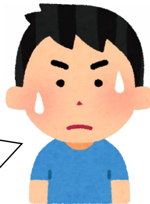
通級指導教室担当