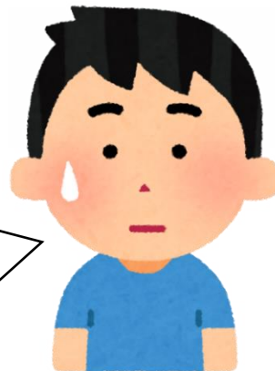
通級指導教室担当

児童の困難に応じて、それを改善する指導を中心に行っているのですが、なかなかできるようになりません。