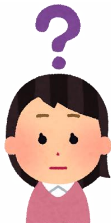
特別支援学級担任

その子にあった指導内容になっているか、その子にどのような指導が必要か悩みながら取り組んでいます。